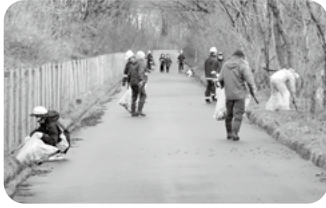
不法投棄されたゴミを拾います。

今年も町内会、団体、事業所から多くの参加があり、約120名がコースに分かれ、不法投棄されたゴミを回収しました。クリーン作戦の活動が周知されてきたおかげか、今回のごみ収集総量は890kgと前回の1,500kgから大幅に減少しました。今回は初の試みとして、『ごみ収集総量当てクイズ』を行い、約50人の方が応募され、実総量に近かった6人に記念品を贈呈しました。