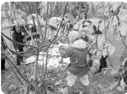
いちじく栽培指導会 (R7.12.2)