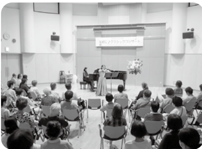
気軽にクラシックコンサート (R7.8.24)