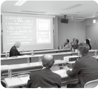
各部会の事業を映像で報告します。