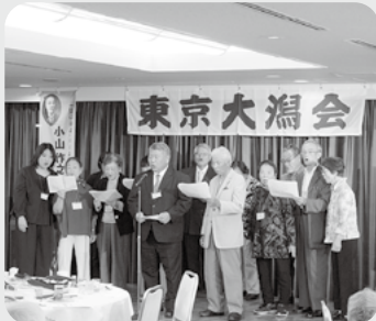
令和7年度東京大潟会 全員で大潟町小学校・中学校の校歌斉唱