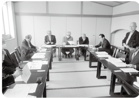
4団体交流会 2月27日吉川区にて

また、諸物価高騰の中、財政問題については、やむを得ず会費の値上げを検討する団体や、費の収納率アップに向け、現役世代層への事業メリットの提供をどう創るか…などに対しては、ニユースポーツ大会などの事業紹介もあり、参考になったところ。その他多くの意見交換の中、それぞれの地域事情に応じた独自の事業展開を諮っている現状の相互理解が進みました。