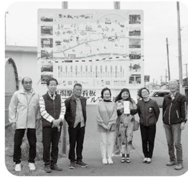
作成にあたった教育・文化部会の委員とデザイナー（右から3人目）

令和5年度上越市地域独自の事業予算により、犀潟駅周辺の散策マップ「犀潟駅から古巡り」と犀潟駅前の看板を作成しました。この看板の完成披露会が、4月21日（日）犀潟駅前で行われ、犀潟周辺の子どもから大人まで大勢の方が訪れ、完成を祝いました。