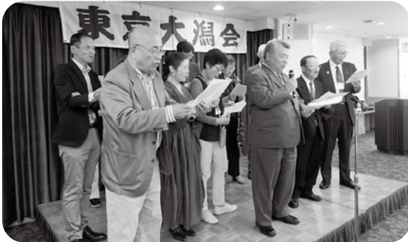
全員で大潟町小中学校の校歌斉唱