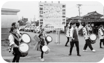
威勢のいい太鼓が鳴り響いた「頸北太鼓 瑞芭」の皆さん