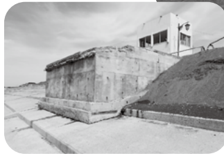
令和6年5月 人魚像の台座土台が露出