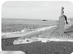
令和5年10月 人魚像付近から徐々に浸食が広がる

人魚像台座付近から直江津側は、海水浴や夏の行楽シーズンに向けて、砂浜の復旧工事が始まりまし