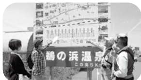
犀潟駅前看板でルートを確認「犀潟駅」

この約2時間のルートは、日本海を望みながらのすばらしいウォーキングです。ぜひマップ片手に散策をお楽しみください。