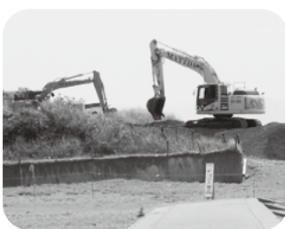
令和6年5月 海水浴場の復旧工事