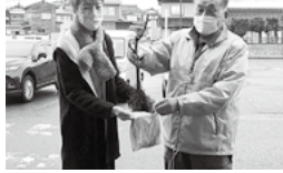
いちじくの育て方を教わりました。

いちじくの育て方について、水やりはどつすればいいのか「力ミキリムシの被害にあつてしまつた」などまちづくり大潟の環境・地域振興部会員に、相談していただきました。