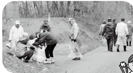
大潟区各町内、団体の方が参加

令和6年3月17日(日) 高速道路側道等クリーン作戦(雁子浜・渋柿浜の範囲)が行われました。今年は、子供から大人まで130名以上の参加者があり、6コースに分かれて不法廃棄されたゴミを収集し、きれいな大潟になりました。 参加者の皆さん、ご協力ありがとうございました。 参加者の皆さん、ご協力ありがとうございました。みんなの努力の結果が、いつまでもキープされることを願います。