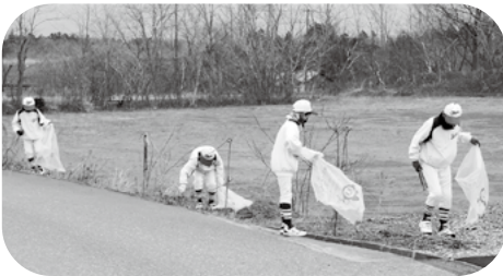
大潟フェニックスの子ども達も一生懸命作業します。