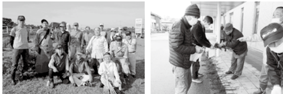
アピールスポットの草刈り (6月18日・8月27日)