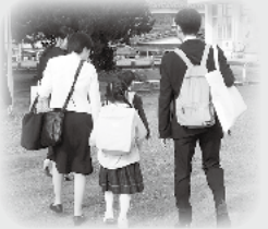
小学校入学式 4月8日 校舎に向かい両親に手をつながれる「ピッカピカの1年生」