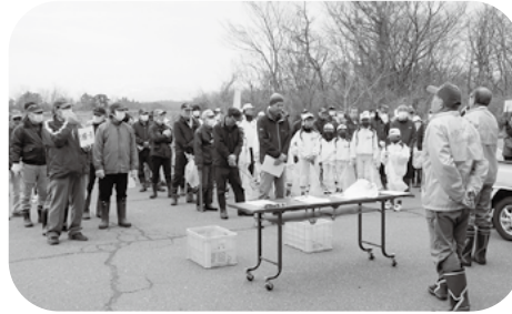
大勢の参加者が集まりました。