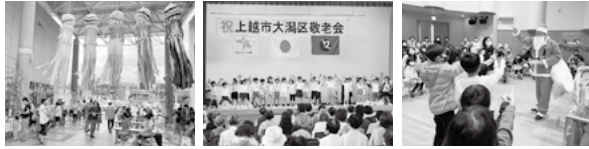
おおがた七夕☆絆まつり・福祉まつり (7月8日) 大潟区敬老会 (9月9日) お楽しみクリスマス会 (12月9日)