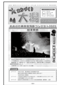
まちづくり大潟広報誌