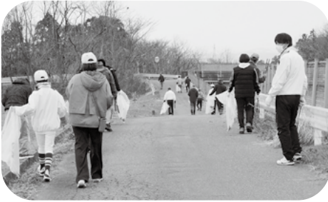
側道のごみを一つ一つ拾います。