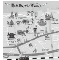
大潟区散策ルート作成事業 (看板は犀潟駅前設置)