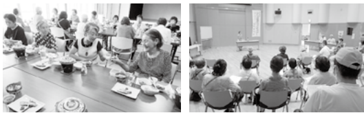
いきいきサロンバス旅行 (深山荘)