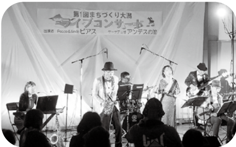
昭和歌謡やポップスなどが次々と演奏され、手拍子したり口ずさんで楽しみました♪