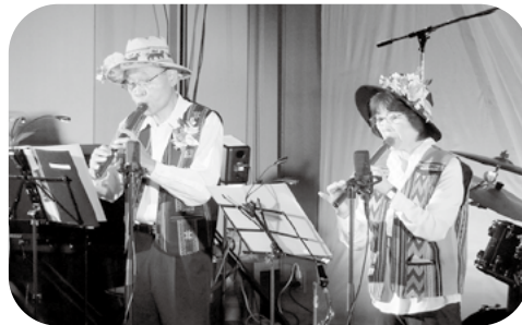
どこか懐かしく、哀愁のあるケーナの音色に会場は包まれました。