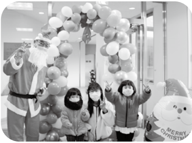
令和4年度お楽しみクリスマス会