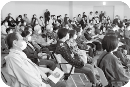
立ち見がでるほど、大勢の観客 「昔の歌が非常によかった!」 「懐かしい。涙がでてきた。」 「生演奏の迫力がすごかった。」 等の声がありました。