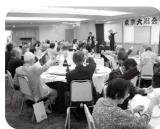
令和元年 東京大潟会総会