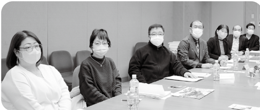
まちづくり吉川（左から3人）とまちづくり大潟の皆さん

2月16日（木）、大潟「コミュニティプラザ」で頸北初となる「頸北最寄り住民組織交流会」を、まちづくり大潟の呼び掛けで開催しました。この交流会には、大潟区をはじめ柿崎区、頸城区、吉川区の住民組織の役員の方々に14人の参加をいただき、組織間の交流を深めるとともに、コロナ禍という受難な状況を踏まえ、地域の課題や方向性又はビジョン等を意見交換することで、地域の活性化に繋がる事業提案の参考にすることを目的に開催しました。