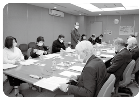
冒頭：柳澤会長から交流会趣旨説明

今回の交流会のように、各住民組織の役員が参加して行うことは合併後初めての試みでありましたが、組織を運営するに当たり共通の課題を抱える者として、情報交換の必要性を共感していただいたことで開催することが出来ました。各住民組織とも市町村合併を機に発足し、概ね18年が経過しています。この間、各地区の社会構造や生活様式の変化又は人口減少等が影響し、課題の一つである組織の後継者不足が、今後の事業展開に支障をきたすようないくつかの課題が山積みしています。