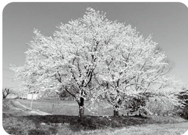
おおがた再発見写真コンテスト応募作品 (長崎地内)