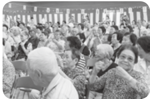
⇒ つつい踊りだします♪