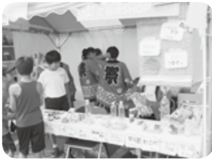
揃いのはっぴで大潟をPR

最初は緊張していましたが、お客さんからの質問に、自信をもって商品を紹介していました。