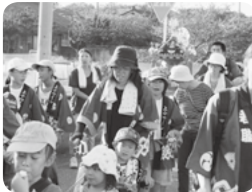
上小船津浜つくし子ども会 9月8日