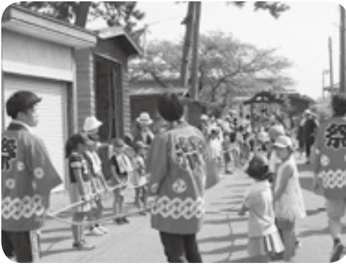
犀潟砂浜子ども会 8月24日