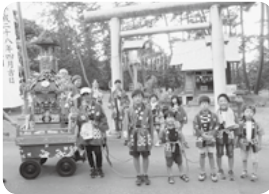
四ツ屋浜子ども会 8月25日