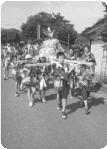
下小船津浜わかば子ども会 8月25日