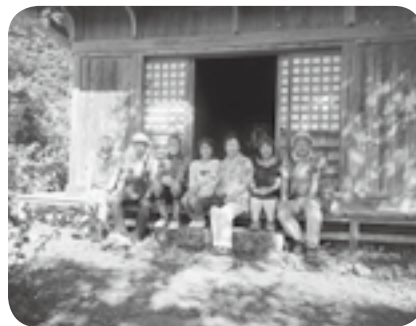
映画『阿弥陀堂だより』のロケ地にて

いただきました。現在、実働の案内人は45名程とのこと。解りやすい説明、まとまったコースそしてしっかりと整備された遊歩道等々。部会として強い印象を受けました。案内人の育成は難しいですが、今後の課題も見つかり、有意義な一日でした。