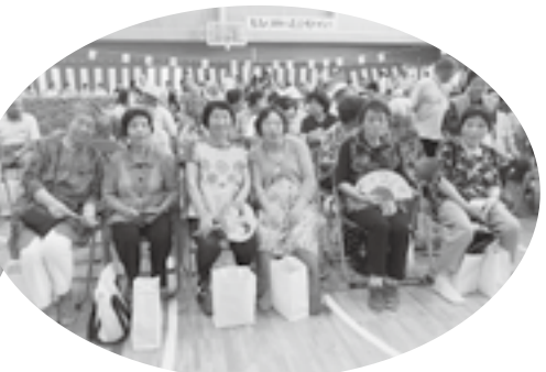
ご近所仲良し六人組(犀潟)