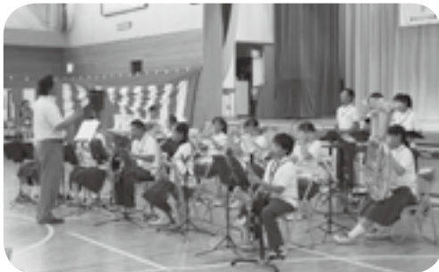
テスト前で大変なのに参加してくれました! (大潟町中学校吹奏楽部)