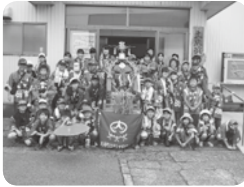
土底浜はまなす子ども会 8月23日