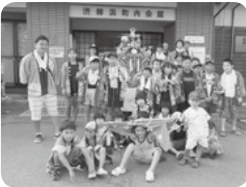
渋柿浜青空子ども会 9月8日