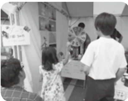
かっぱ賞(いちじく羹)を狙って!