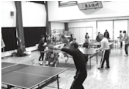
↑【土底浜】 9歳から76歳まで4クラスで熱戦!