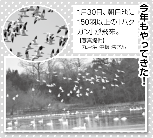
1月30日、朝日池に150羽以上の「ハクガン」が飛来。