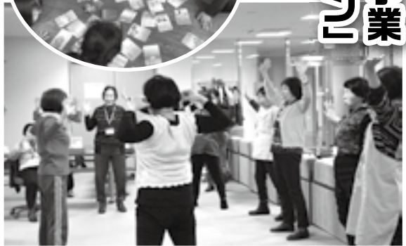
↑ 2月4日、筋肉量や体年齢の測定をして、冬場の運動不足解消で簡単な体操をしました。

毎週月曜日、午前10 時〜大潟コミュニティ ニテイプラザ 2階にて開 催。参加費 100円。