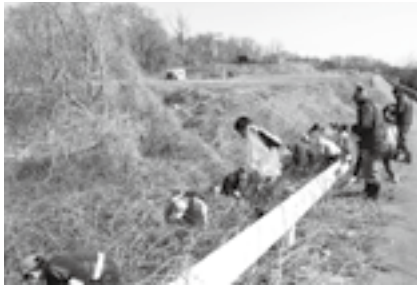
「住みよいまち」を目指して、今年も実施します! ご協力をお願いいたします。

大潟区の生活環境の保全と美しいまちづくりを進めるため、高速道路側道などのクリーン作戦(ごみ拾い)を実施します。