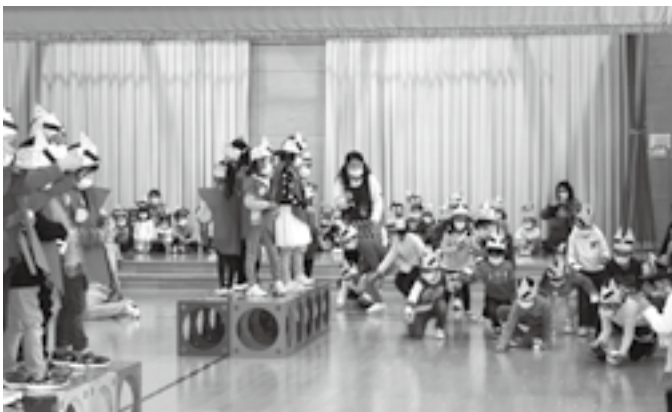
↑年長児さんが「かみしも」を着て豆まき！（はまっこ）

2月1日、まつかぜ保育園（園児数101名）では全園児がホールに集まり、節分の「豆まき」が行われました。 年長児さんが、代表としてみんなの心の中にいる「泣き虫鬼」や「おこりんぼ鬼」を追い払うため大きな声で「鬼は外！」と豆まきをしました。豆拾いが終わったころ：ドン、ドンと大きな足音が聞こえてきて、ホールに赤鬼と黄鬼が現れました。鬼の登場に、逃げ回る子や先生にしがみついている子、勇敢に鬼に豆を投げる子の姿も見受けられ、「たくさん鬼に豆をなげた！」、「こわかった！」と感想が聞けました。