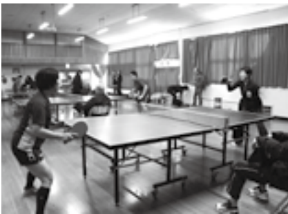
↓【潟町】 シングルス&ダブルス戦。応援も過熱