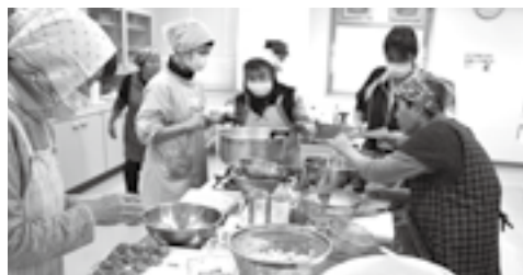
↑ 2月8日、減塩メニュー4品を調理。 美味しくできあがりました!