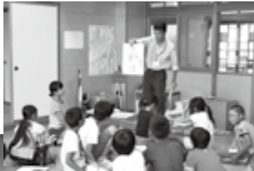
← 開校式の様子。ボランティアの先生の質問に手をあげて答えました。

今年の宿題サポート教室には、一年生から六年生まで過去最高の46名の応募があり、2班に分かれて学習をしました。その他、英語の歌を歌ったり、工作、レクレーションなど充実した内容で6日間行いました。毎年宿題サポート教室を楽しみにしている子供もいて、夏休みの楽しい時間を過ごすことができているようです。