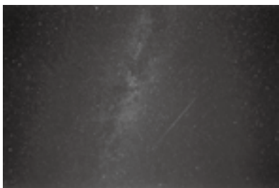
8月13日午後10時20分頃 カシオペア座からはくちょう座の 天の川と天頂方向に流れた ペルセウス座流星群☆

3大流星群の一つ「ペルセウス座流星群」朝からの期待をよそに、この2日間は雨回り。それでも夏休みが手伝ってか親子連れなど60人ほどの参加がありました。 なかなか顔を見せない星達を待ちつつ、しばらくは銀河鉄道の夜を鑑賞。やがて現れる木星、土星、火星…。東の空にとらめっこしながら、じっと待って…。 しかし、流星の数はわずか。観ることができた人も少なく、「流星ショー」とはいきませんでしたが、美しい夏の夜空を十分に楽しむ事ができました。