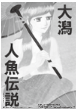
平成29年度・3年生が作成

まちづくり大潟事務局カウンターに絵はがきを置いてあります。お知り合いの方など、お便りにぜひ、お使いください。