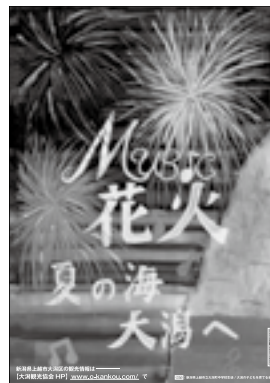
平成28年度・3年生が作成