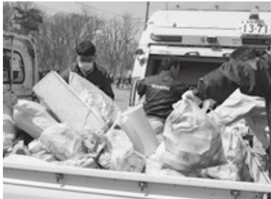
↑回収したごみが軽トラックに山積み

3月25日、高速道側道等のクリーン作戦を実施しました。町内会、事業所、団体、中学生のボランティア総勢250人が4班に分かれて捨てられているごみを拾いました。大潟パーキングエリア周辺には、テレビやストーブなどの粗大ごみが捨てられていました。不法投棄が少しでも無くなり、住みよい町になつて欲しいと願います。