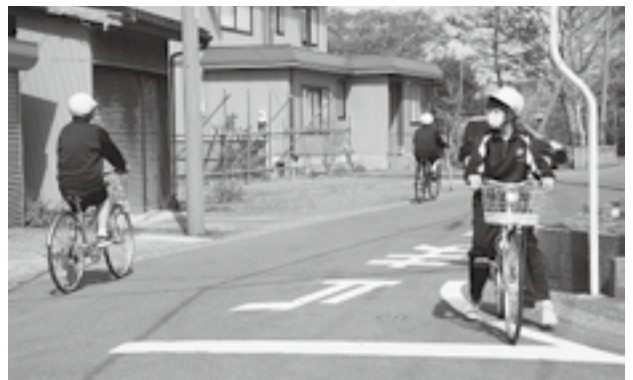
↑ 真新しい自転車に乗り、慎重に実技講習を受けていました。

4月16日、大潟町中では新入生（77名）の交通安全教室が行われました。自転車通学生は公道およそ1キロのコースを自転車で走行し、一時停止や左右確認、横断などの実技指導を行いました。徒歩、電車通学生は体育館で自転車交通事故を防ぐためのDVD視聴をし、正しい自転車通行を学びました。交通安全教室には、潟町駐在所長やPTA地域活動部員、大潟の子どもを育てる会安全安心対策部員の方々が指導にあたっていました。