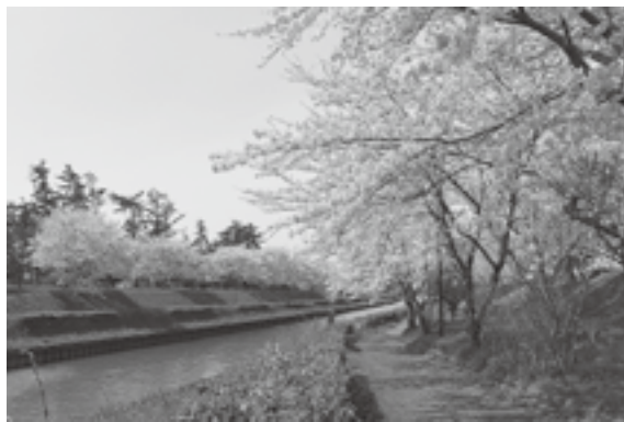
【犀潟・新堀川】サイクリングコース、遊歩道があり、お散歩コースにおすすめ♪