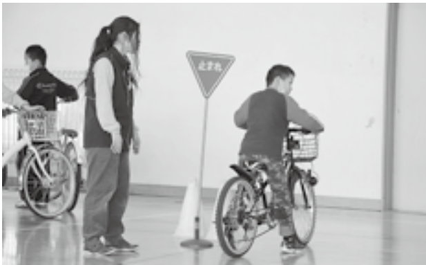
↑ 4年生からは、「いつもより考えながら自転車に乗って、緊張した。」「曲がる所がむずかしかった。」と感想が聞けました。

4月17日、大潟町小4年生（65名）は、土底浜駐在所長や上越市地域安全支援員、ボランティアの方々の協力のもと、体育館で交通安全教室を行いました。大潟町小では4年生から校区内を一人で自転車に乗れることになっていきます。子供も大人も交通ルールを守り、安全運転を心がけて交通事故にあわないように、地域で取り組みましょう。