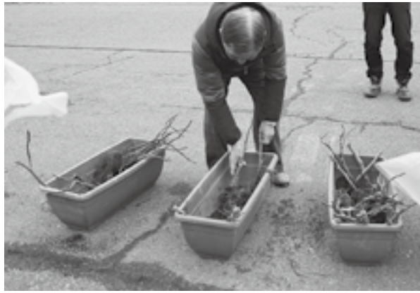
愛情込めて育てた苗木は毎年、好評です

3月21日、いちじくの苗木販売を行いました。大潟区内外の方々から申込みをいただき、苗木約170本を販売しました。産業振興部会で挿し木を行っている品種は「蓬萊柿」で皮が薄く、甘みが強い昔懐かしい味のいちじくです。栽培方法の説明書は、まちづくり大潟事務局にあります。ご利用ください。