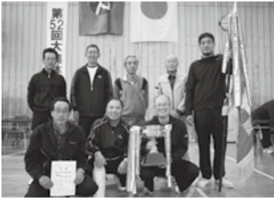
今年も優勝! 蜘蛛池・潟田チーム

小雨が降る10月15日、大潟体育センターにて、おおがたスポーツクラブ主催「第52回大潟体育祭」が開催されました。13チームが各種目で熱戦を繰り広げ、蜘蛛池・潟田チームが優勝し、5連覇を成し遂げました。競技終了後には、スポーツクラブ・ヒップホップダンス教室の子供達が元気にダンスを披露し、会場から温かい拍手が送られました。