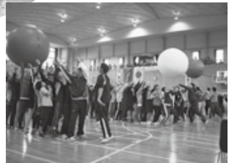
勢いをつけて、「それ~!」