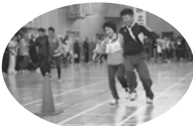
さすが、夫婦!! 息ピッタリ♡