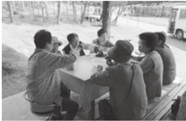
甘くておいしいねえ

下小船津浜サロンでは9月20日、ぶどう狩りに出かけました。ぶどうの食べ比べをしたり、お土産を購入したりと秋の味覚を堪能されていました。その後、坂口記念館で昼食と休憩。午後はメンバーさんのご希望で、一〇〇円均一ショップへ行き、買い物を楽しまれました。