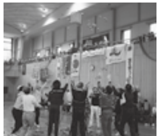
「せ~の!」と息を合わせて