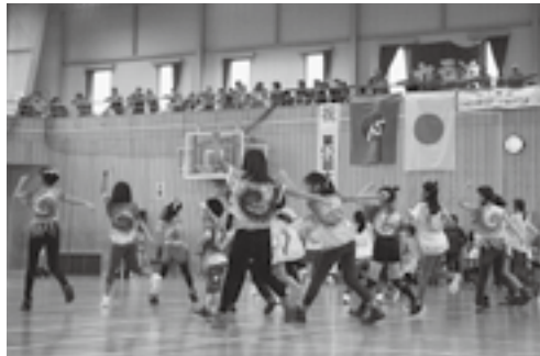
笑顔で元気よく踊ってくれました!