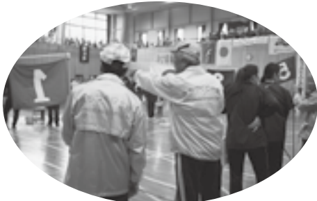
↑まちづくり大潟も大会役員としてお手伝いしました。