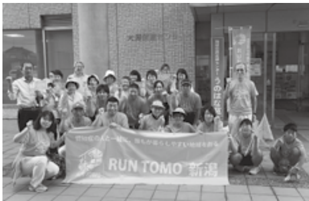
成功を祈って記念撮影♪