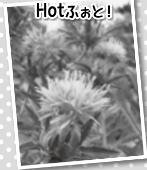
体育センター南側に咲いた紅花 九戸浜 山岸さん

1〜6年生50名が参加し、お昼には流しそうめん、地域貢献として町内グラウンドの草取りに汗を流し、その後人魚館のプールで楽しんだあとは町内会館でバーベキュー。日が暮れた頃には花火、きもだめしと盛りだくさんの内容で子供も大人も楽しい1日を過ごしていました。参加した子供からは「今までよりも楽しくて、みんなとかかわり