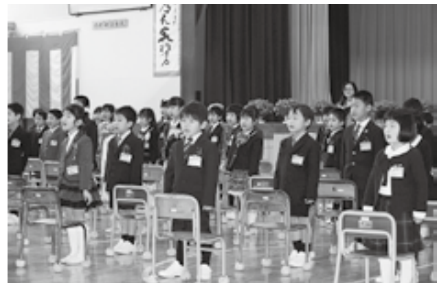
緊張した面持ちで在校生と対面。あいさつをする一年生

「自分でできることは自分でしましよう。」と話し、担任の先生に名前を呼ばれると、大きな声で返事と共に起立をしていました。在校生からは、「学校はたのしいよ。みんなやさしいよ。いっぱいあそぼうね。なかよくしようね。」と歓迎の言葉が述べられました。上越市からは、黄色の安全帽が贈られました。交通事故や不慮の災難に遭わないように見守り、地域で子供たちの成長を応援しましょう。