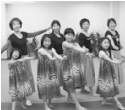
キッズから楽しめるフラダンスです。