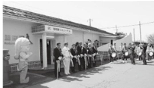
来賓を迎えてテープカット!