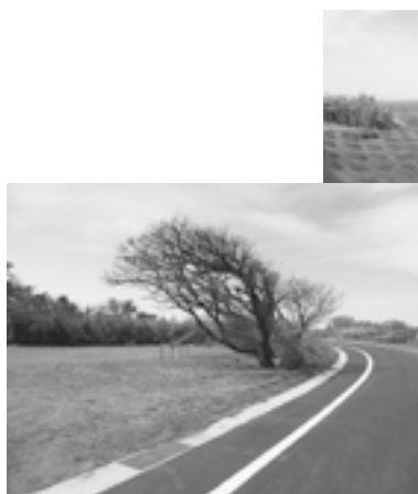
海を見下ろす散策路が続き、エノキやクロマツなどが配置されている。

土底浜の海岸沿いに残る馬蹄型の古屋敷跡。冬の季節風を防ぐため家の周囲に土を盛り小高くしてエノキなどで、強風から家を守っていた名残りです。これらの歴史を刻んだ先人の知恵と大潟の自然を学ぶことができる公園が4月1日にオープンしました。駐車場も整備され、誰もがくつろげる公園になっています。是非利用してください。