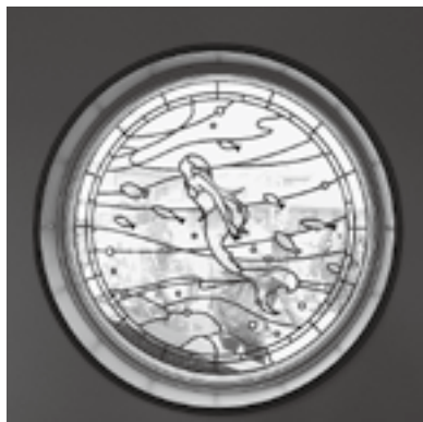
人魚のスタンドグラス

を伝える工夫が施されています。同じ日、イベント列車の『越乃しゅくら』が、停車することもあり、ホームから歓迎とお見送りも行われました。『酒蔵』をモチーフとしたこの列車が停車する駅として、大潟の観光もさらに盛り上がり、地域情報発信の場として期待されています。潟町駅として生まれ変わりました。