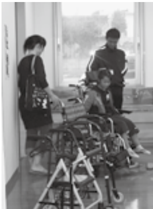
車椅子を体験できました

開催日が大潟作品展と同じ日でしたが100人余りの方々が訪れ、熱心に見ていただきました。