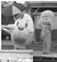
ゆるキャラ代表『つのもちゃん』↑

会場では来年の、いちじく苗木（日本いちじく蓬萊氏）の斡旋販売のご質問があり、ふたたび大潟に定着しつつあることを実感しました。来年の苗木販売は3月21日（春分の日）を予定しています。お楽しみにお待ちしております。