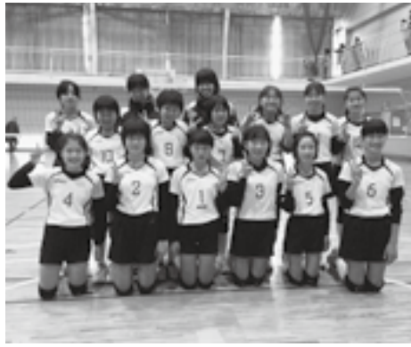
メンバーの集合写真

大潟町小学校体育館に集合し、揃いのピンク色のTシャツでバレーボールの練習に励んでいる6年生6名、5年生7名が『マーメイド大潟』のメンバーです。