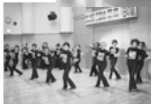
レクダンス、八社五社のみなさん

区内の13団体が参加し、第2回芸能の祭典「白の器」が大潟コミュニティプラザで開催されました。