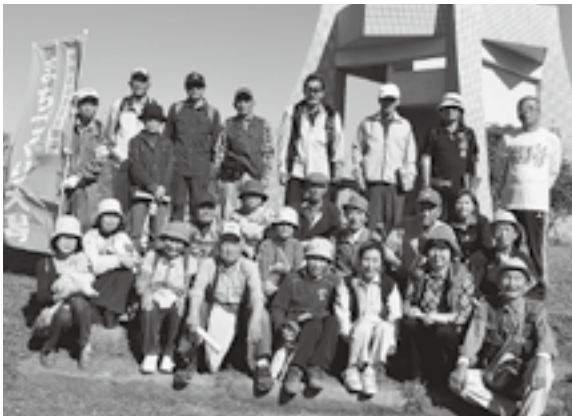
夕日の森公園で記念撮影

『海岸てい線柱』では、海岸浸食が進んでいることがよくわかり、環境問題を身近に感じました。長年、大潟に住んでいても、まだまだ知らないところがたくさんあり、歴史を知るとともに、大潟の素晴らしい自然に触れることができる、このような機会をこれからも大切にしていきたいと思えます。