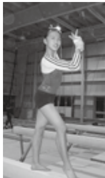
平均台の演技。 台の幅は10cmしかない。