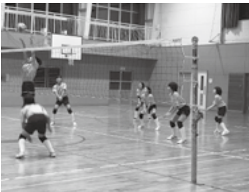
大きな声を掛け合い練習しています

クラブでは現在、小学2年生以上のメンバーを募集しています。興味のある方は、まず見学にきてみませんか？お待ちしています。練習は水曜日の午後7時からと土曜日の午前9時からです。