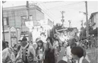
各地区の力作の神輿が練り歩いた