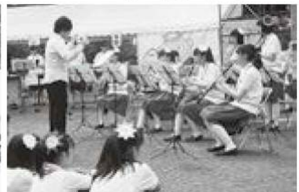
ふれあい広場では、八社五社、ポリネシアンダンス、中学生の吹奏楽、などなど……盛りだくさん!