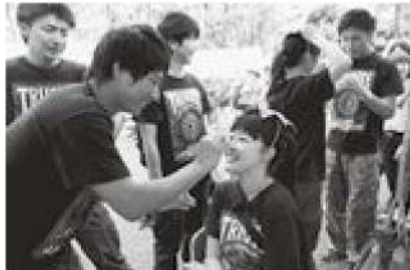
お化粧も念入りに! かつぱに変身