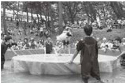
かつぱ相撲、応援にも熱が入った