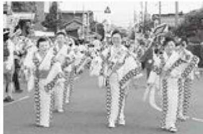
大潟小学校長先生も参加! 民謡流し