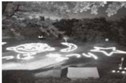
中学生の手によるエコキャンドルの灯り