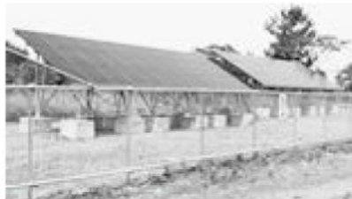
集落北側に設置された太陽光パネル