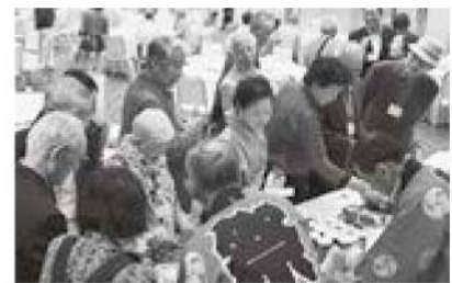
ふるさとの物産品販売は大盛況

したので知人がいたら教えて下さい。また、総会後の懇親会を同級会として利用していただき