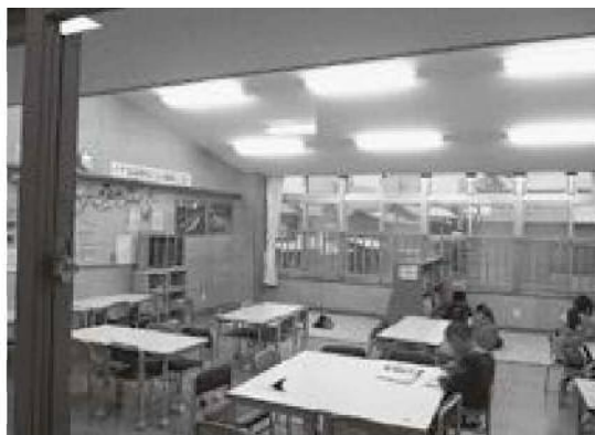
放課後児童クラブ室

大潟放課後児童クラブ(学童保育)は、この児童館の中にあります。こちらも児童福祉法に基づいてつくられたものですが、保護者の子育てと就労の両立を支援するために運営されています。対象者は小学校1～6年生で有料です。基本的には月曜～金曜の午後2時30分～午後7時、土曜日や長期休業日は午前8時～午後7時まで利用できます。(日曜・祝日休み)