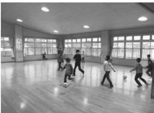
児童遊戯室は時間を決めてボール遊びをする

児童福祉法に基づいて、児童に健全な遊びを提供し、仲間作りや自発的な活動を通じて心身ともに健やかな児童の育成を図るための施設です。児童や保護者が無料で気軽に遊ぶことができます。開設時間は原則として、月曜～金曜の午後1時～5時。土曜日は午前9時～午後5時です。(日曜・祝日休み)