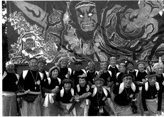
メンバーは28名。笑顔が弾けます。

かっぱ祭りでは、ねぶた模様の山車で会場を盛り上げ、地域のお祭りでも工夫を凝らした灯籠が話題の『潟町1区有志会』。結成はなんと27年前のことです。