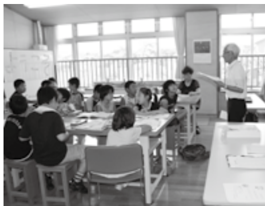
開校式もなごやかに!

まちづくり大潟広報版 お知らせ 第85号 発行 まちづくり大潟 発行責任者 後藤 紀一 発行日 平成24年9月1日 TEL/FAX 534-6810/6815 HP http://o-gata.hs.plala.or.jp E-mail bz821727@bz03.plala.or.jp