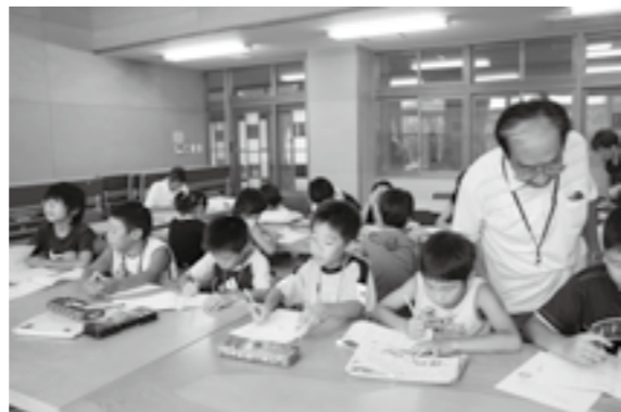
先ずは学習。宿題もすぐに終わったよ