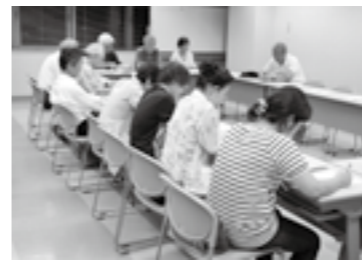
敬老会の打ち合わせ会議

当日は60余名のボランティアのみなさんから運営に携わっていただきます。是非、会場に足を運んで敬老会をお楽しみ下さい。万全の準備を整え、お待ちしています。