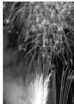
夜はカラフルな色彩花火

又、8月中は、水、木曜日に打ち上げられた『色彩音楽花火』が、好評で、25日の鵜の浜温泉祭で締めくくられました。