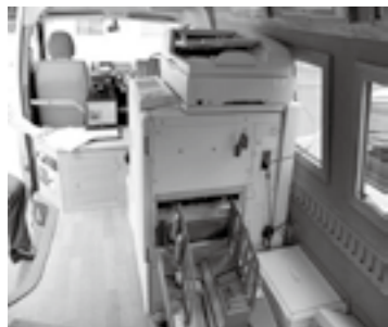
デモ機とプリカのデザイン(予定)