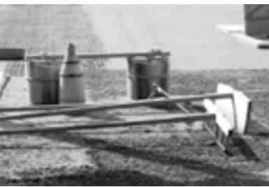
海水を撒いた後、乾燥した塩田 (写真は大潟のものではありません)

大人達は仕事で忙しく、水道設備もない時代だったので生活に使う水を毎日汲んで置くのが私の役目でした。その他に、妹の子守も私の担当です。