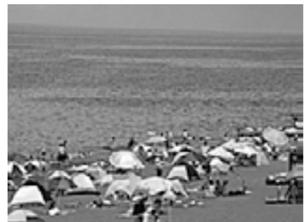
色とりどりのパラソルでいっぱい砂浜