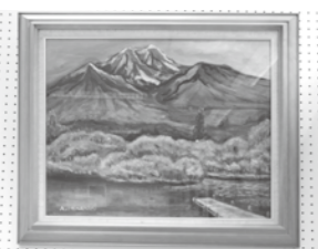
「妙高の春」油彩 五十嵐朝子(渋柿浜)