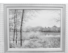
「眺望~県立大潟水と森公園~」油彩 牛来伸吉 (南相馬市)