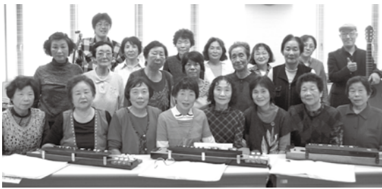
グループの枠を越え全体練習をしています。

「クリスマス発表会」 日時 12月4日(日) 13時30分より 場所 大潟コミュニティプラザ2階