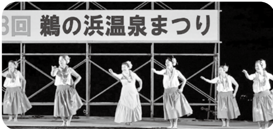
団体活動支援助成金 マカリカ・フラ大潟