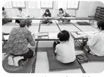
いきいきサロン (9団体)