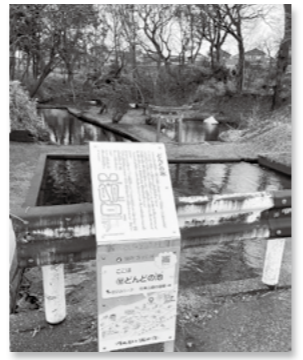
新テーマ「作之助と潟町宿」より「どんどの池」

今年も大潟の写真が大募集します。応募期間は令和4年7月1日～令和5年1月31日です。今回のテーマは「おおがたの魅力」と「作之助と潟町宿」です!写真は、データのみで、画像データ(CD-R等)を郵送、ホームページまたはメールで応募してください。 アドレス: bz821727@bz03.plala.or.jp ホームページ: http://www.o-gata.hs.plala.or.jp/ まちづくり大潟事務局へお持ち込みでも結構です。 (大潟コミュニティプラザ内 平日9時～16時)