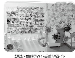
福祉施設の活動紹介

〈福祉まつり〉 大潟区内の福祉施設や団体等による、活動内容の紹介と作品展覧等を行います。