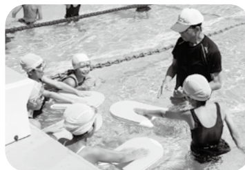
活力ある地域づくり助成金 おおがたスポーツクラブ

まちづくり大潟では、例年各種事業を展開する中で、部会事業と市の受託事業に加え、住民が主体となり自らが主人公となって活動し、住民のコミュニケーションから地域づくりに結び付けている各種団体に運営の支援を行い応援をしています。 この団体等への助成事業は、①団体活動支援助成金事業、②活力ある地域づくり助成金事業、③大潟区花壇団体助成支援事業があり、また各地区のいきいきサロンには、運営補助金を交付しています。(各助成金事業の申請は、まちづくり大潟事務局に問合せください。)