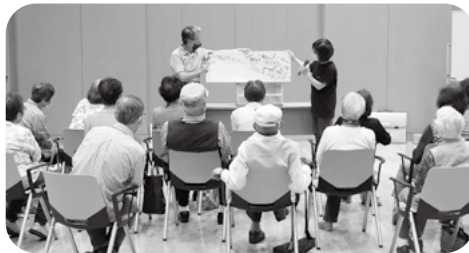
団体活動支援助成金 えほんのひろば