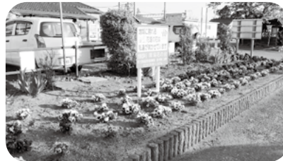
大潟区花壇整備団体 (11団体)