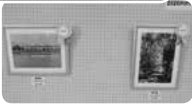
《最優秀作品と優秀作品》