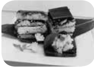
郷土料理【押しすし】