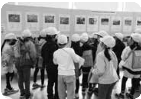
大潟町小学校児童が見学 総合学習の成果として、3年生（現4年生） の写真と俳句も、同時に展示されました