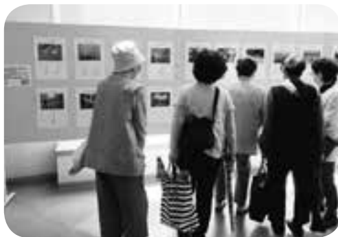
小学生の写真に「きれいに撮れているね」 子供らしい素直な俳句に笑顔がこぼれます♪