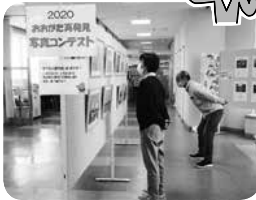
入賞作品14点が展示されました