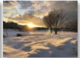
御手洗池と 雪と夕焼け

総合学習の成果として大潟町小学校3年生（現4年生）の児童の写真と俳句も展示します！