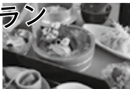
写真はイメージです 季節により変更します。