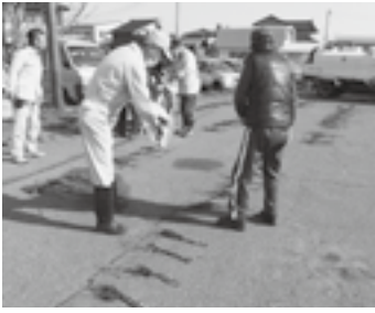
いちじくの実の収穫が楽しみです♪

購入した人は、「肥料は何がいい?」「防虫対策は?」と質問し、『大事に育てます』と笑顔で持ち帰りました。