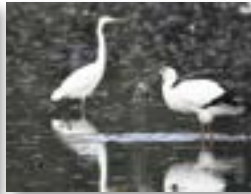
魚をとる コウノトリとサギ