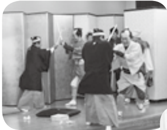
殺陣もしっかり決めます☆

第3部は土底浜笑劇団の皆さんによる寸劇「水戸黄門」。出演者は土底浜町内会、まちづくり大潟、社会福祉協議会大潟支所からも参加です。セリフなのかアドリブなのか...黄門様御一行と悪家老達のやり取りに、笑いがとまります。