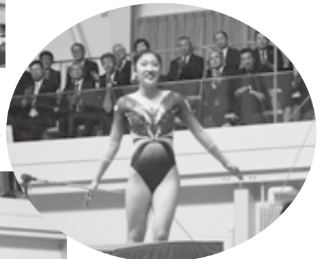
←日本女子体育大学 新体操部