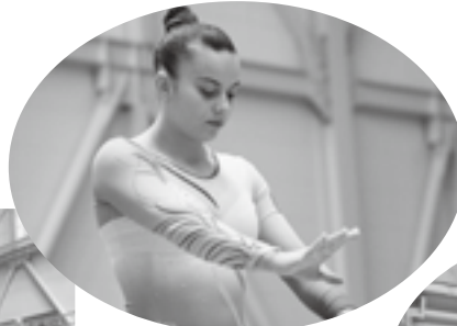
↑ポルトガル 女子体操選手