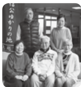
うの花句会のみなさん