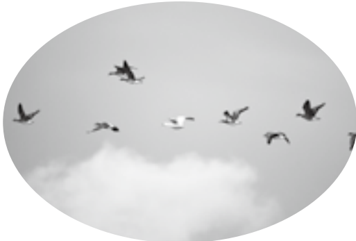
1月6日ハクガンが一羽、朝日池に飛来

※地域活動支援事業についての相談は、地域振興班でいつでも受付しています。お気軽にご相談ください。