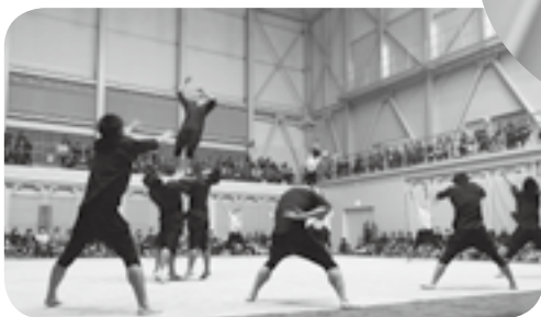
←国士舘大学 男子新体操部