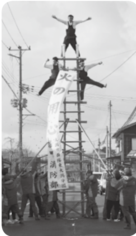
3人の組演技がばっちり 決まりました!(潟町)