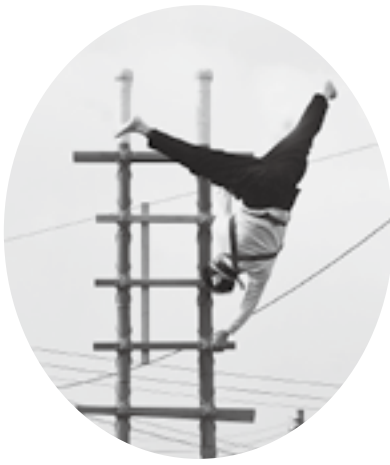
風が吹いている中、集中して 演技します(潟町)

火災や災害のない1年を祈念して 令和2年1月5日、大潟区の各町内で、1年間の無火災と無病息災を祈り、出初式が行われました。今回は潟町町内会と土底浜町内会の出初式の様子を取材しました。 潟町消防部の出初式では、神明宮境内でのお祓い後、潟町町内19箇所を木遣り歌が流れる中、梯子乗りを披露しました。 特に冬場は火の元に注意が必要です。消防団の皆さん達が日頃から練習を繰り返し、町内を守ってくれることが心強いですね。