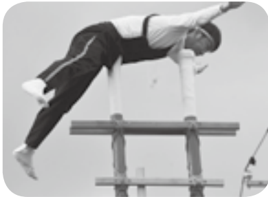
見事な二本大の字の演技(潟町)

HP http://www.o-gata.hs.plala.or.jp/ 事務局ブログ、ぜひご覧ください! E-mail bz821727@bz03.plala.or.jp