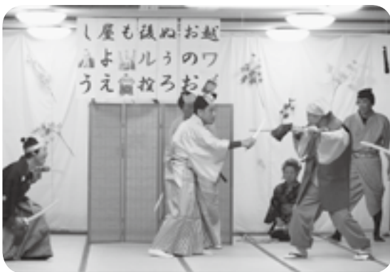
抱腹絶倒の寸劇を期待ください！