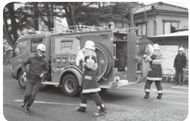
新年にふさわしく、キビキビした訓練の様子(土底浜)