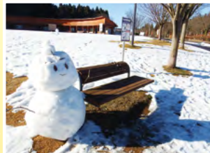
『冬の都市公園・来園歓迎!だよ』