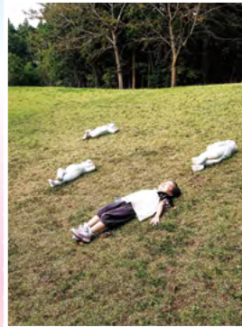
『河童と昼寝できる場所』