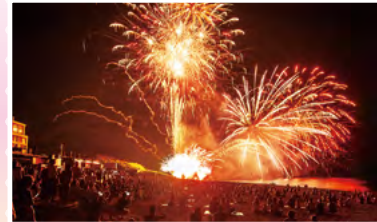
『鵜の浜海岸の夏』 栗本 実